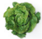
de la Salade