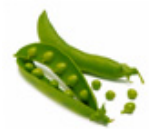
des Petits pois